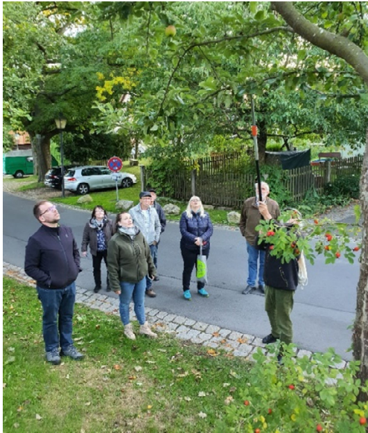
Bauerngartentag Bergnersreuth am 11. September 2022